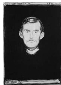
Э. Мунк. Литография «Автопортрет», 1895

После двух коротких пребываний в больнице и двух временных улучшений в деревне она отправилась в центральную