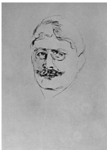
Э. Мунк. Портрет Кнута Гамсуна

Немецкая оккупация: враг стал конкретным и явным