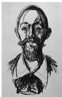
Э. Мунк. Литография «Профессор Якобсон»