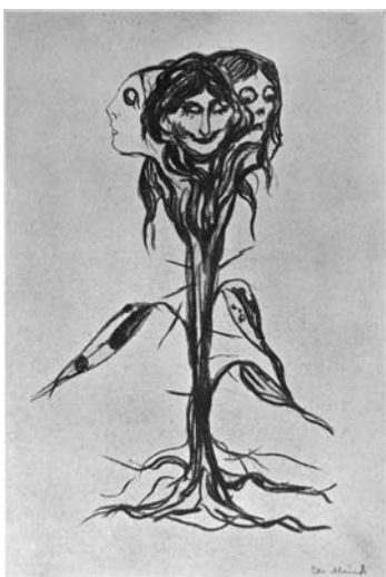
Э. Мунк. Литография «Ядовитый цветок», 1908–1909

Невозможно представить себе художника без покупателя. В создании стиля эпохи участвуют двое – художник и его заказчик. Каким бы независимым не хотел казаться автор, ему не обмануть ни себя, ни потомков. Отличие больших талантов от маленьких в том, что первым со временем начинают платить именно за то, чтобы они оставались самими собой и умножали себя. Поскольку их индивидуальность хорошо продается. Но, так или иначе, люди коллекционирующие искусство, это та публика, на которую обычно ориентируется мастер, добывающий пропитание средствами своего мастерства. Значит, чтобы понять, чего стоит искусство, надо узнать, кто за него платил.