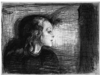
Э. Мунк. Литография «Больная девочка», 1896

на Мунка. Он был военным врачом в крепости Акерхус, в главном штабе норвежского военного командования; кладбище Христа принадлежало к гарнизонной собственности. В 1924 году некрополь был почти разрушен, по современному городскому плану его здесь быть не должно [5].