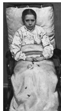
Кристиан Крог. «Больная девочка», 1880–1881

Если задаться целью посетить всех покойных членов этой семьи, необходимо побывать еще и в пригороде Осло – Нордстрани. Здесь покоятся последние Мунки. На первый взгляд, надгробие выглядит как обычная могильная плита. На фронтальной части гранитного монумента только имена: Лаура Мунк (1867–1926) Карен Бьельстад (1839–1931) и Ингер Мари Мунк (1868–1952) . Но, если обратить внимание на заднюю часть плиты, обнаружится необычное продолжение: «Здесь покоятся с миром тетя Эдварда Мунка, которая замени-