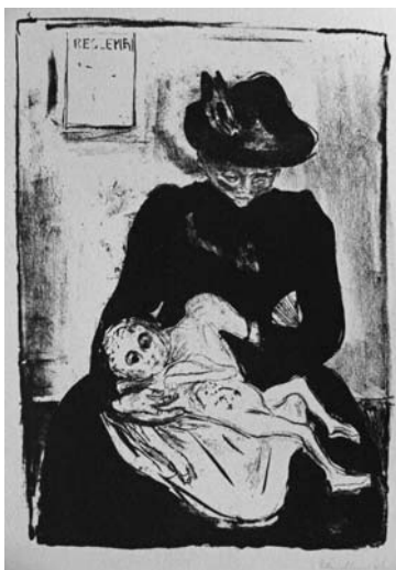
Э. Мунк. Литография «Наследственность» (по мотивам картины)

Холодность Э. Мунка по отношению к немецкому искусству