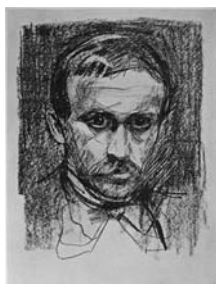
Э. Мунк. Литография «Портрет поэта Обстфельера»

Сомнение в «ментальном здоровье» Э. Мунка приверженцами косных взглядов