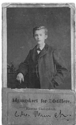
Юношеская фотография Эдварда Мунка