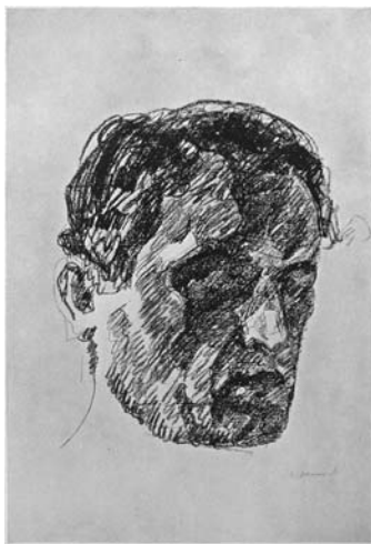
Э. Мунк. «Автопортрет», 1912

Искусство – единственная цель жизни Э. Мунка