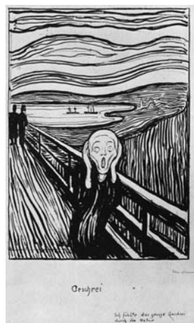
Э. Мунк. Литография «Крик», 1895