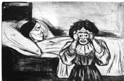
Э. Мунк. Литография «Мертвая мама и ее ребенок», 1900–1901