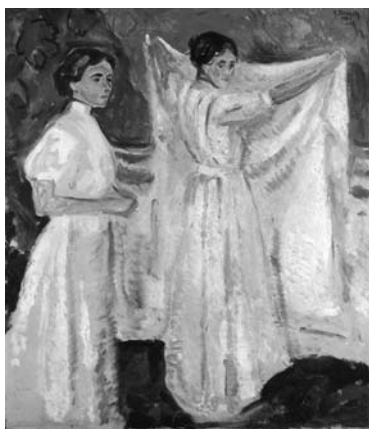
Э. Мунк. «Две медсестры», 1908–1909

Значит, не обошла стороной нашего героя и эта семейная напасть. Но в отличие от сестры, Эдвард быстро вернулся к нормальной жизни. Еще пребывая в клинике, Э. Мунк узнал, что его заочно приставили к награде орденом святого Улафа. Эта не самая высокая награда в Норвегии, тем не менее – отличный повод простить своим соотечественникам все обиды. Творчество помогло Э. Мунку ради этого большого дела, этой сверхзадачи он жертвовал многим и ради нее жил. Победить своих недоброжелателей, прославиться, реализовать свой талант, в который безропотно верят там далеко, – у него дома теть Карен и две сестры.