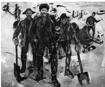
Э. Мунк. «Рабочие за уборкой снега», 1913

ные равнины». Даже тот, кто видел только черно-белую репродукцию этого шедевра, оценит нечеловеческую смелость газетного преувеличения. А вот известная группа художников-реалистов, называвших себя «братья-фресочники» (норвежские мастера времен Нюгорсволла* – трудившиеся в незавершенной рагуше Осло), получили настоящую взбучку. По всему видно, что норвежские нацисты вообще потеряли нить рассуждений о хвором или здоровом искусстве. Куда важнее для