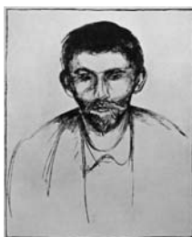
Э. Мунк. Литография «Портрет Станислава Пшибышевского»