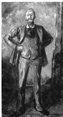
Э. Мунк. «Доктор Даниель Якобсон» портрет в полный рост, 1908–1909

в северной Норвегии врачом, женился, и у него вот-вот родится малыш – первый за много лет в семье Мунков!