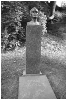
Надгробный памятник Эдварду Мунку в Осло